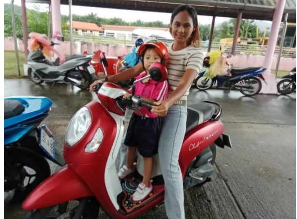
ภาพกิจกรรมการฝึกทักษะการคาดเข็มขัดนิรภัย